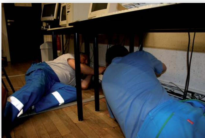
Travaux de câblage dans la salle informatique de l'école des Vosges