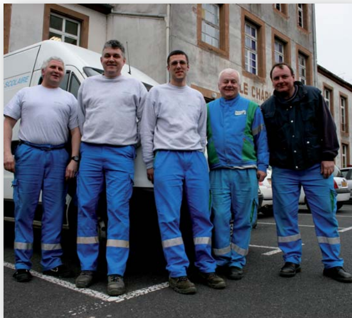
Les agents de l'équipe d'intervention

Offrir à tous les petits sarrebourgeois les meilleures conditions d'accueil dans les écoles est l'une des priorités de la municipalité.